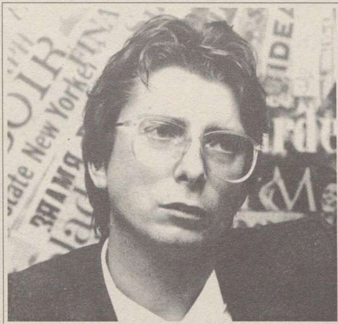
Alex Langer, deputato europeo del Gruppo Verde

Io non sono sicuro che le odierne forme organizzative dei Verdi che si conoscono in Europa siano di grande durata. La sfida verde contiene in sé enormi elementi di novità, primo fra tutti il tradurre in politica un impegno all'auto-limitazione; la prima ondata di verdismo ha obbligato tutti a confrontarsi con l'emergenza ecologica e ha introdotto il problema dei limiti di crescita. Se le attuali rappresentanze verdi non servono a far crescere e governare queste consapevolezze, ben venga la loro sparizione. La storia spazza via chi arriva in ritardo.