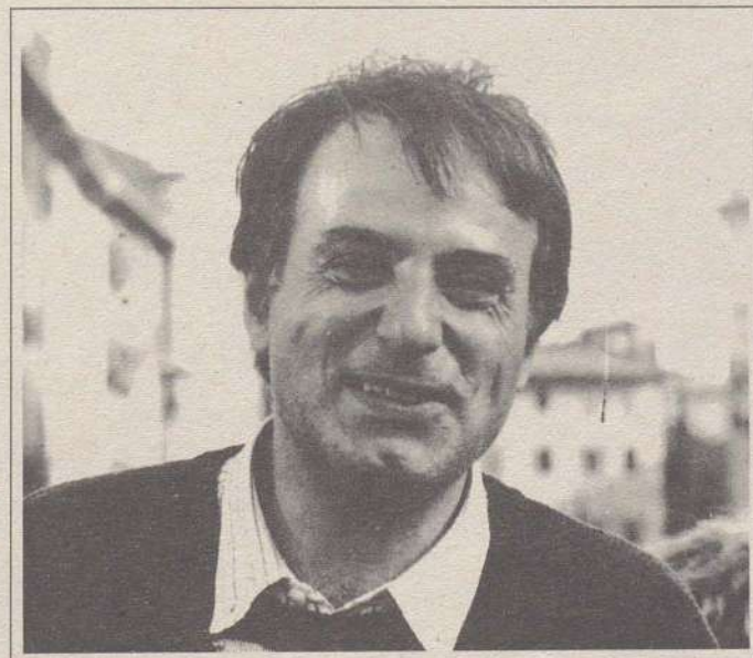
Gianni Mattioli, deputato al Parlamento Italiano del Gruppo Verde

tro indirizzo: costituirsi come forza politica a sé, autonoma dal movimento associativo. E così le associazioni, piano piano, scendevano su un terreno non di uso dello strumento Liste Verdi, ma di aperta competizione, e quindi all'interno delle Liste Verdi è venuto a configurarsi un personale politico che magari non aveva mai partecipato ad azioni di base, ma che in compenso era espertissimo in statuti e regolamenti.