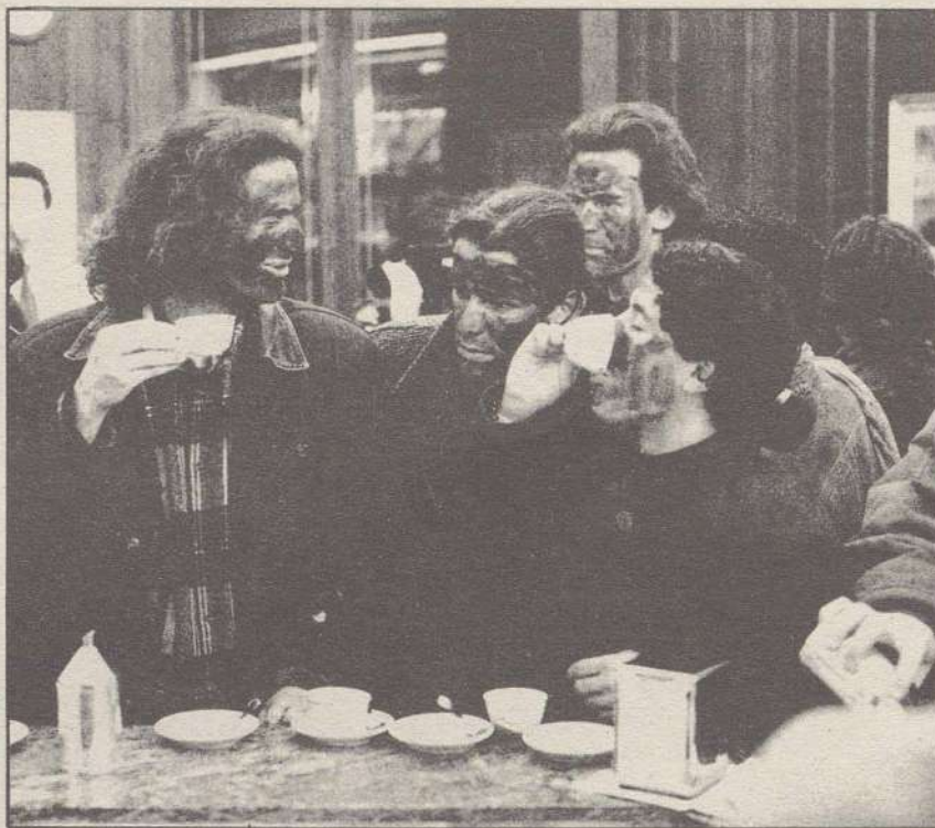
Studenti universitari fiorentini della "Pantera" durante una manifestazione di solidarietà ai giovani lavoratori immigrati di colore si sono tinti la faccia di nero.

E' irresponsabile limitarsi al moralismo o continuare a nutrire i nostri sensi di colpa, anche se è importante rendersi conto che le nostre filosofie dei diritti civili illimitati non possono servire a risolvere la situazione. Occorrono delle scelte politiche che non devono riguardare solo gli extracomunitari, ma anche gli zingari, i barboni per scelta, i contadini, gli artigiani manuali, i possessori di dialetti e lingue locali, nonché chiunque sta fuori dei canoni della civiltà urbana avanzata. Per proteggere e liberalizzare questi modi di vivere, come quelli degli Yanomami brasiliani, lombardoveneti o albanesi delle due